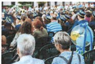
O CEREMONIE DE ABSOLVIRE LA NIVEL DE UNIVERSITATE

Pentru orice informații suplimentare, studenții au avut posibilitatea de a adresa întrebări la adresa de email: festivitateabsolvire@e-uvt.ro