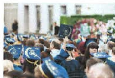
KITUL ALUMNA/ALUMNUS UVT