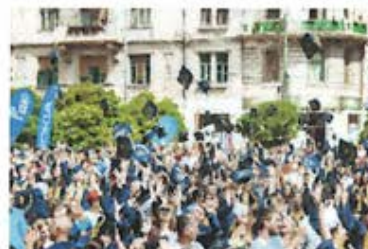
O CEREMONIE LA NIVEL DE FACULTATE